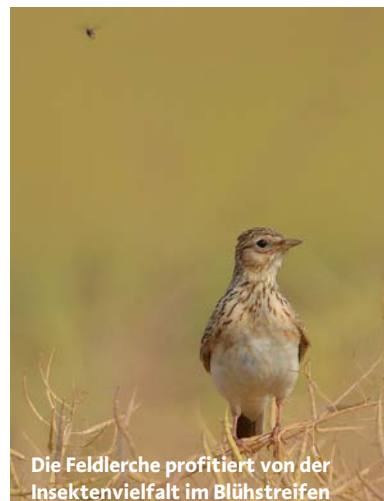
Die Feldlerche profitiert von der Insektenvielfalt im Blühstreifen