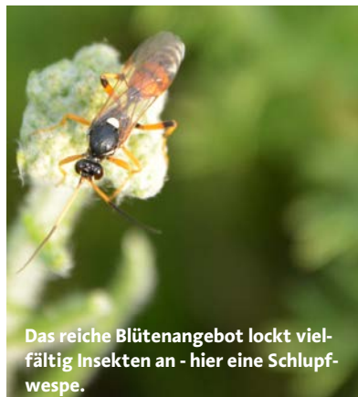
Das reiche Blütenangebot lockt vielfältig Insekten an - hier eine Schlupfwespe.