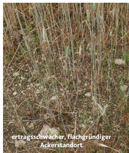
ertragsschwacher, flachgründiger Ackerstandort