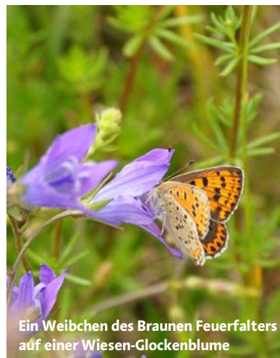
Ein Weibchen des Braunen Feuerfalters auf einer Wiesen-Glockenblume